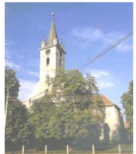
Evangelische Kirche Sächsisch Regen

DW Baden . DW EKD . DW Württemberg . DW Bremen . DW Rheinland . DW Pfalz . Bildungswerk Weilau Heddesheim