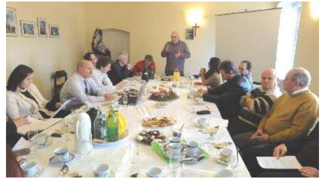
Vorbereitende Gründungskonferenz im Evangelischen Gemeindehaus Reghin, Dezember 2011

ES wird von einem Beirat aus Vertretern der verschiedenen politischen, pädagogischen, kirchlichen und gesellschaftlichen Verantwortungsbereiche der Region begleitet.